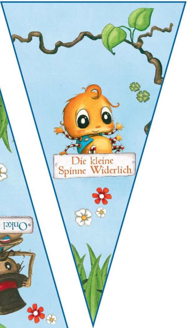
Die kleine Spinne Widerlich